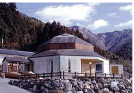
洞戸円空記念館 当館には円空さん最高傑作といわれる一本作り三像をはじめ、30体近くの円空仏が展示してあります。みなさまを慈愛に満ちた円空ワールドへご案内いたします。