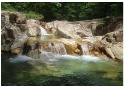
高賀渓谷・高賀自然公園 高賀渓谷は、川底がはっきり見える高い透明度と白い岩が特徴で、まれにみる自然の宝庫です。