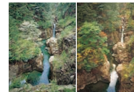
川浦溪谷 全長数Kmに及ぶ断崖の渓谷。その荘厳さとは対照的に、春には新緑が、秋には紅葉が見事な景観を作り出します。