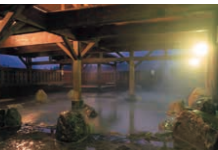
板取川温泉「パーデハウス」 板取川のせせらぎに耳を傾け、澄み切った山の中央と川風がほてった肌心地心地よい。そんなナチュラルな感動が味わえる板取ならではの露天風呂があります。