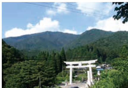
高賀山 標高1224.2mあり、山頂からは御嶽山、白山、奥美濃の山々などの眺望もすばらしく、古くから信仰の山として知られています。