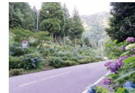
あじさいロード アジサイロードは、「日本の道百選」にも選ばれた美しい街道です。アジサイロードとあじさい園に5万本、21世紀の森公園に1万本、シーズンには板取地域は、あじさい一色となります。