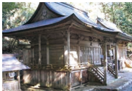
高賀神社 古来より高賀山振興の拠点として、四十八ヶ寺もの堂宇が建ち並んでいたと言われ、円空をはじめ多くの修験者が集まった高賀の郷の社群。