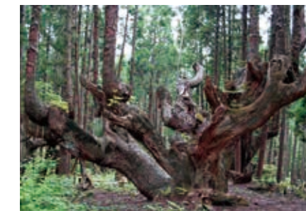
21世紀の森公園の株杉 一本の幹が地上2m～6mの位置で複数に分かれている巨大な「株杉」。推定樹齢は400～500年といわれ、「21世紀の森公園」内に50株ほど群生しています。