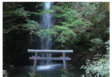
岩門の滝 巨大な岩の門の隙に約20メートルの滝があります。鎌倉時代の後期より高賀山に集まる修験者による修行が盛んに行われていたと伝えられています。